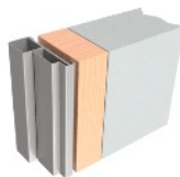
Karmtyp C, ej foderbildande